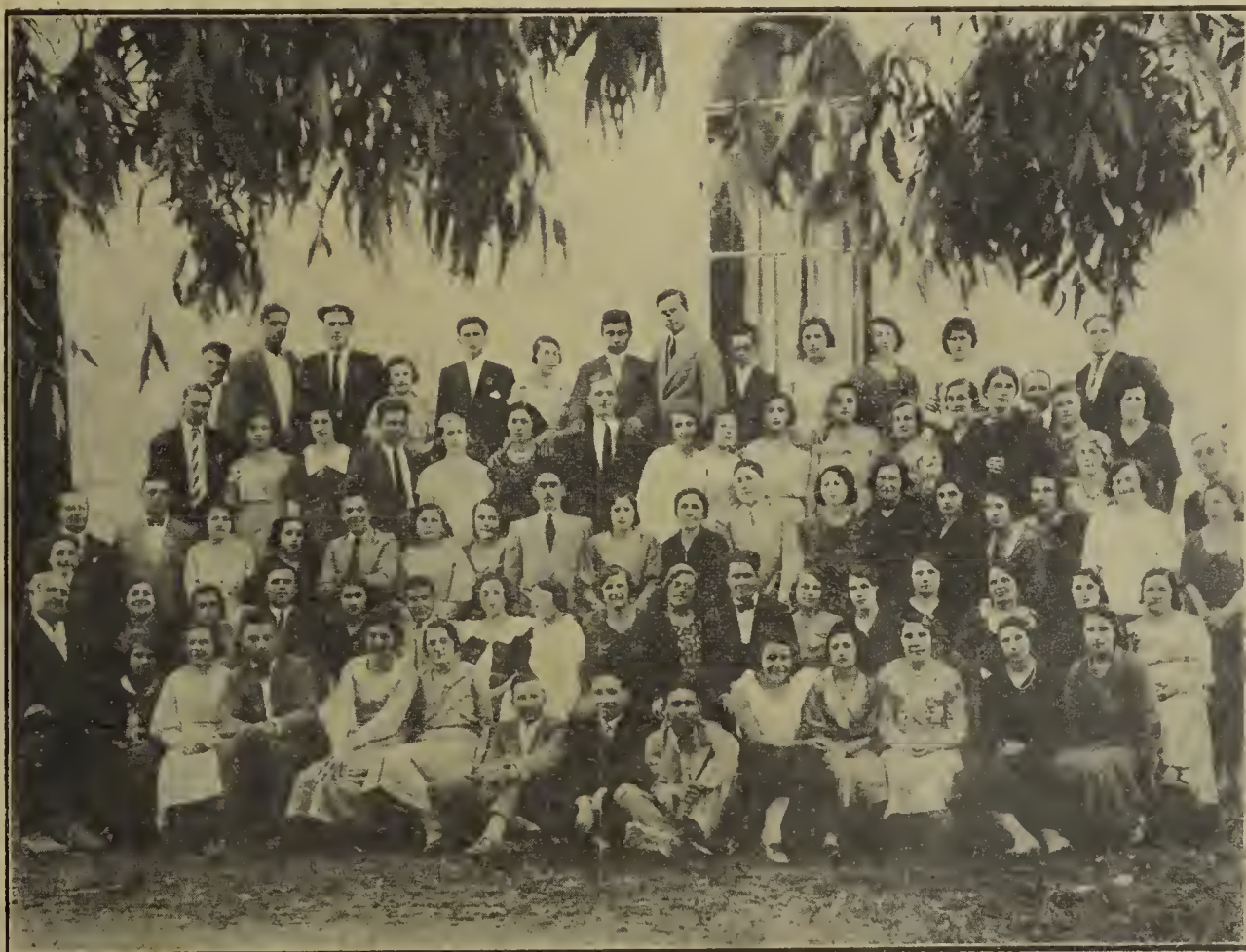
Jóvenes que tomaron parte en la "Fiesta de Canto" realizada en la Iglesia de Colonia Iris, el día 3 de diciembre de 1933

a) Que nos llamemos "pueblo" o bien "iglesia valdense", no es exactamente una misma cosa, como algunos pretenden: al pueblo pertenecemos por descendencia natural: de la iglesia formamos parte por personal elección. Pero, sea que demos mayor importancia a ésta o a aquél, es de todo punto necesario que existan en nosotros estos dos sentimientos, de la unión y de la gratitud, y que a ellos demos especial realce en esta feliz circunstancia: se ha conmemorado un hecho, es decir, el establecimiento de un corto número de personas, en un determinado lugar de nuestro territorio, hacia fines del año 1858. Pues, esas pocas familias, forma-